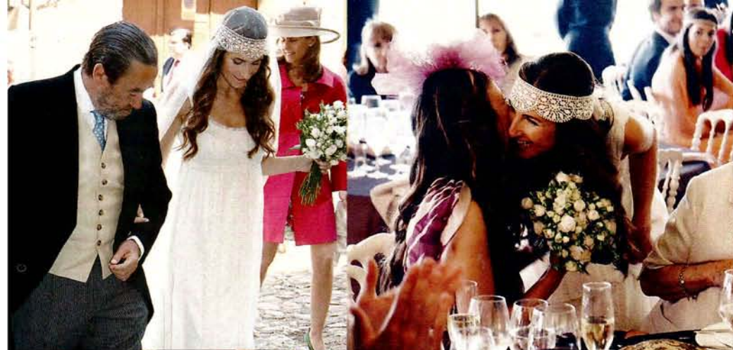
«Con mi madre».