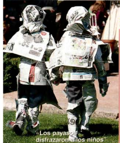
«Los payasos disfrazaron a los niños»

«ME EMOCIONÉ cuando entré en la iglesia mientras sonaba la ópera Turandot ».