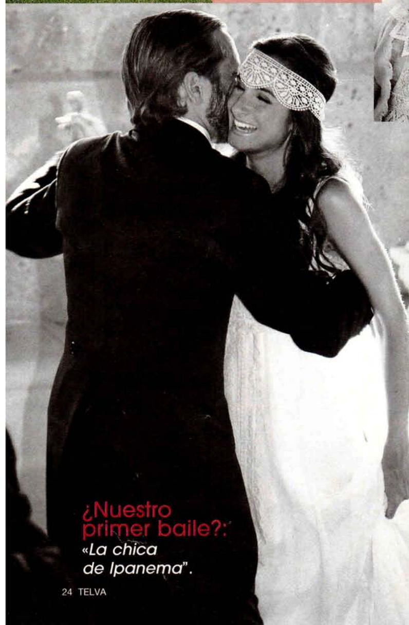
¿Nuestro primer baile?: «La chica de Ipanema».

ALMUERZO DELICIOSO: «Lo celebramos en Los Claustros de Ayllón (Tel: 932 634 524) y el catering lo sirvió Vatelía (Tel: 618 631 131). Las mesas estaban decoradas con centros altos de rosas, lilas y hojas de hiedra. Las mantelerías eran de tafeta marrón y las sillas, estilo francés de madera blanca».